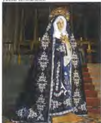
Años 2.000: En 2.007 se estrena un nuevo palo bordado en los Talleres Peña Luengo de Badajoz.