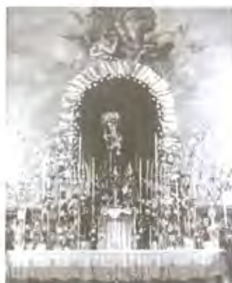
Años 50: En 1950 se estrena el paso adquirido en los Talleres Villarreal de Sevilla y el palo negro de los Talleres de Esperanza Perea de Carrasquilla.