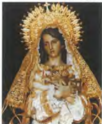
Años 80: En 1988 desaparecen las secciones de Damas y Caballeros de la Virgen, unificándose bajo una sola Junta de Gobierno.