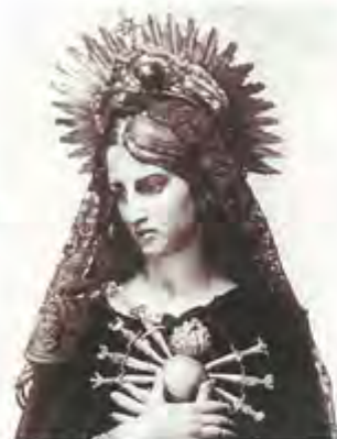
Años 40: El 25 de Julio de 1943 llega a Villanueva de la Serena la imagen de Ntra. Sra. la Virgen de los Dolores.

Para conmemorar el LXX aniversario de la venida de la Virgen se celebrará Eucaristía de Acción de Gracias y procesión extraordinaria el día 15 de Septiembre.