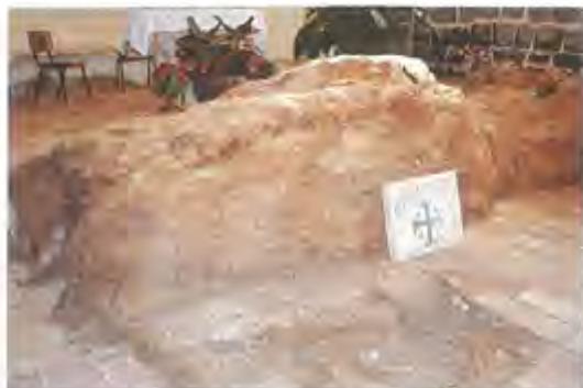
Primado de Pedro

Con la flexibilidad del calendario lunar, nos aproximamos a la celebración de nuestra Semana Santa a finales del mes de marzo, y para cada uno de nosotros sigue siendo un tiempo de especial densidad, porque decimos y afirmamos que estos son los días centrales del calendario litúrgico, condensados de modo privilegiado en el triduo pascual.