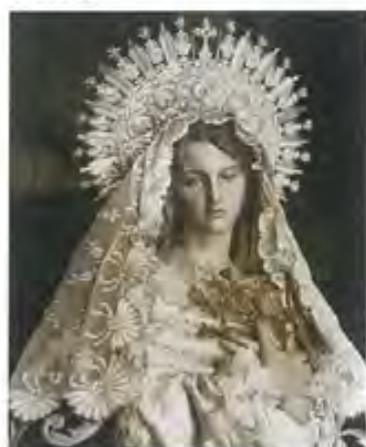
Años 70: En los años 70 la Cofradía se vuelca en acciones caritativas como la construcción de viviendas sociales, la labor asistencial a ancianos y becar seminaristas.