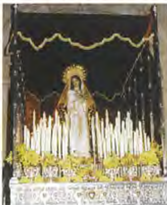
Años 90: En 1991 se constituye canónicamente la Cofradía y en 1992 se recupera el palo para los desfiles procesionales.