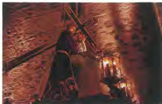
Nuria Tena Pérez - 2011