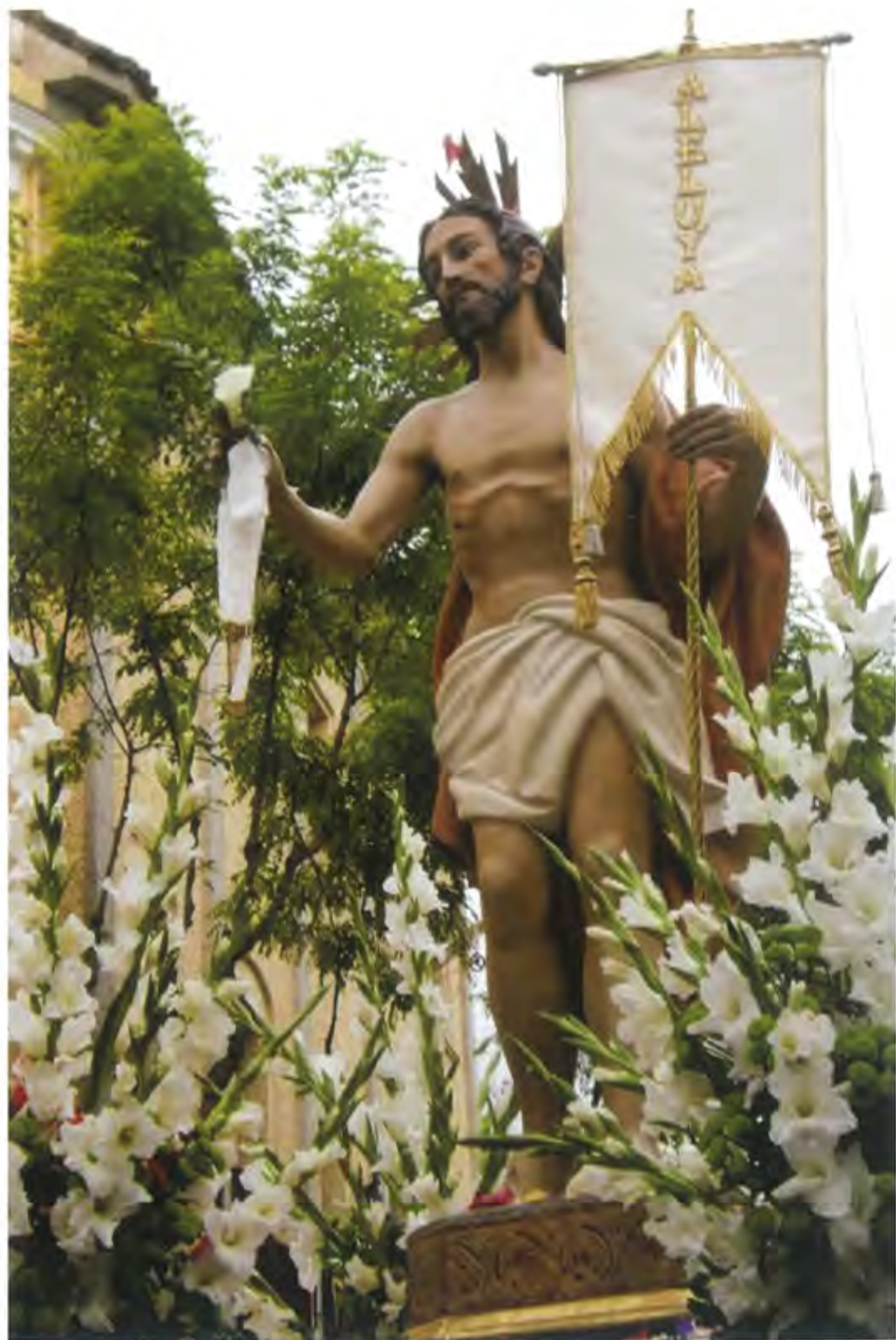
Semana Santa 2012 - Villanueva de la Serena - 26