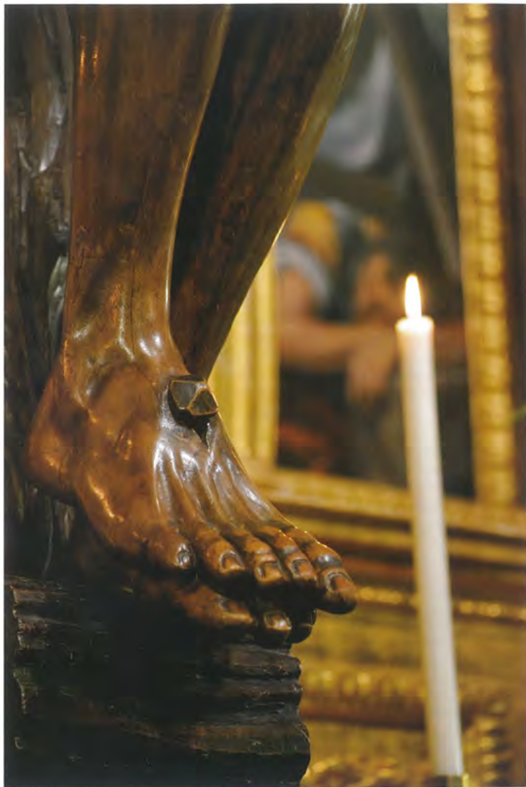
Semana Santa 2012 - Villanueva de la Serena - 22