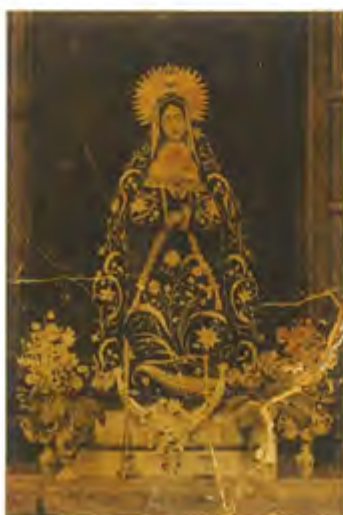
Virgen de los Dolores