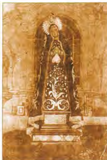
Virgen de la Soledad