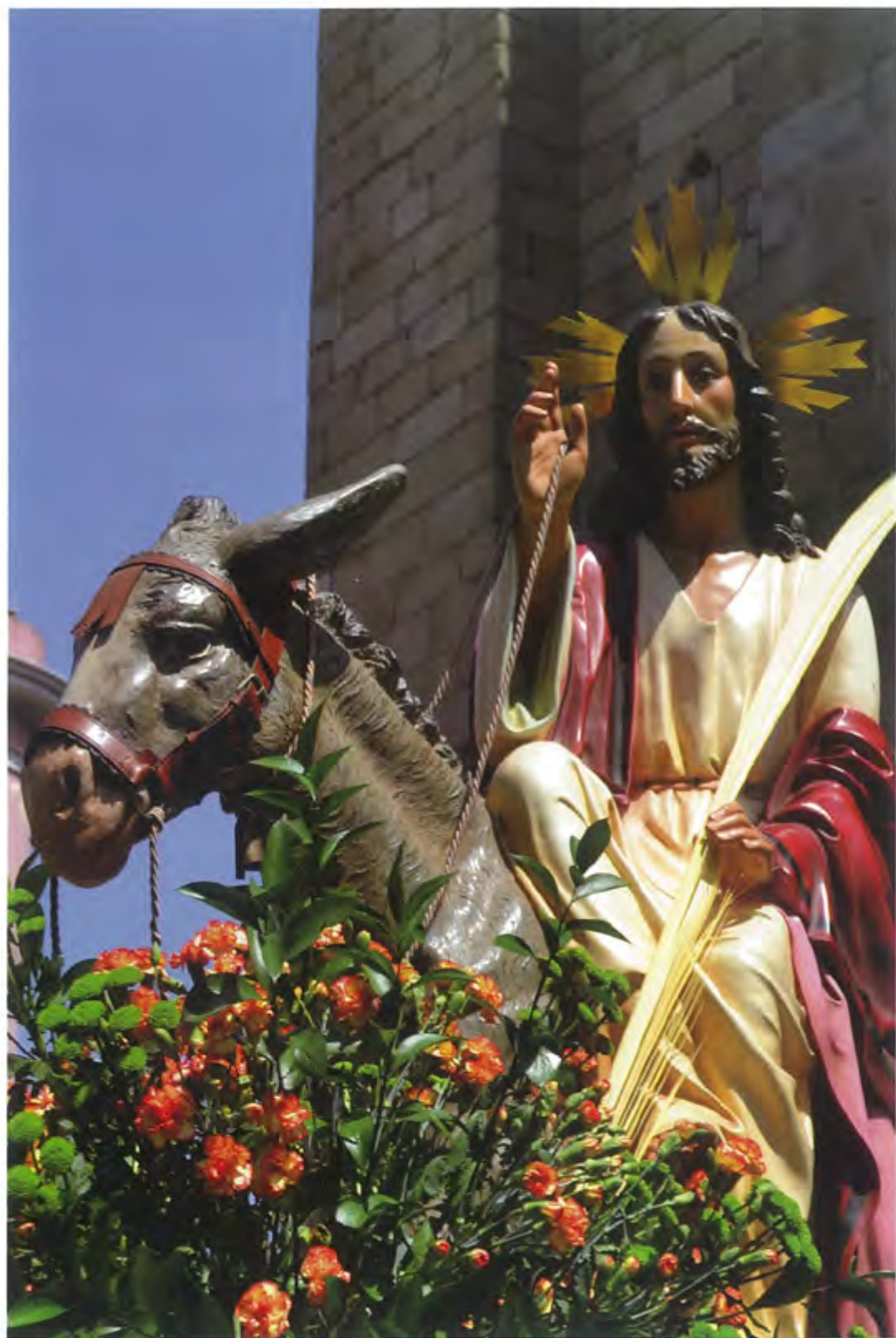
Semana Santa 2012 - Villanueva de la Serena - 16