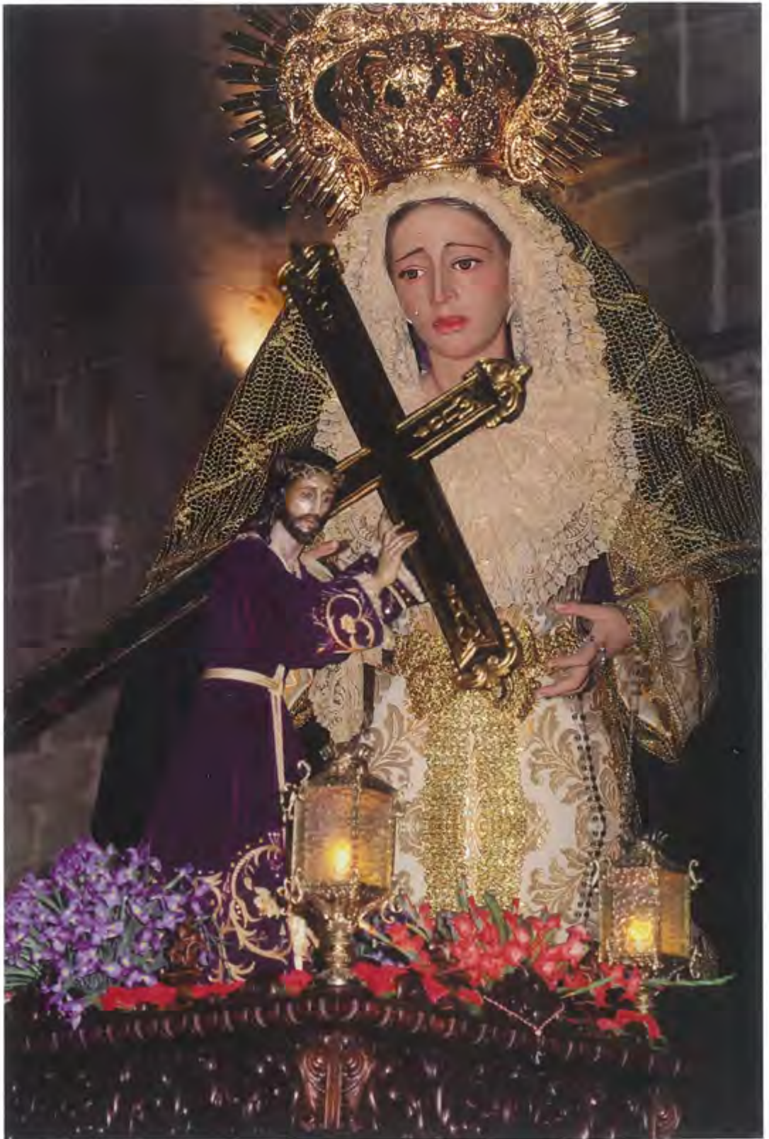
Semana Santa 2012 - Villanueva de la Serena - 20