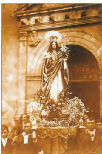
Virgen de la Aurora