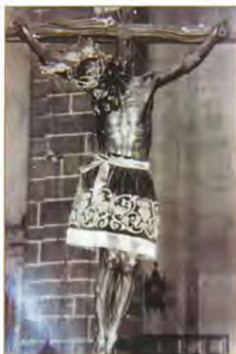
Cristo de la Pobreza