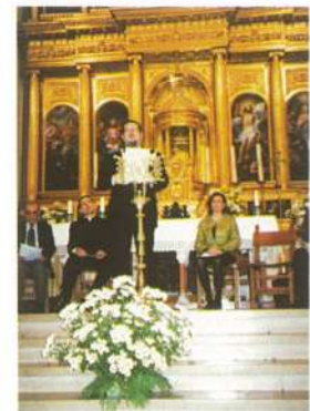
Pregón año 2000