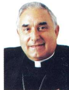
+ Santiago. Arzobispo de Mérida-Badajoz