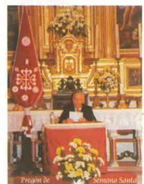
Pregón año 2004