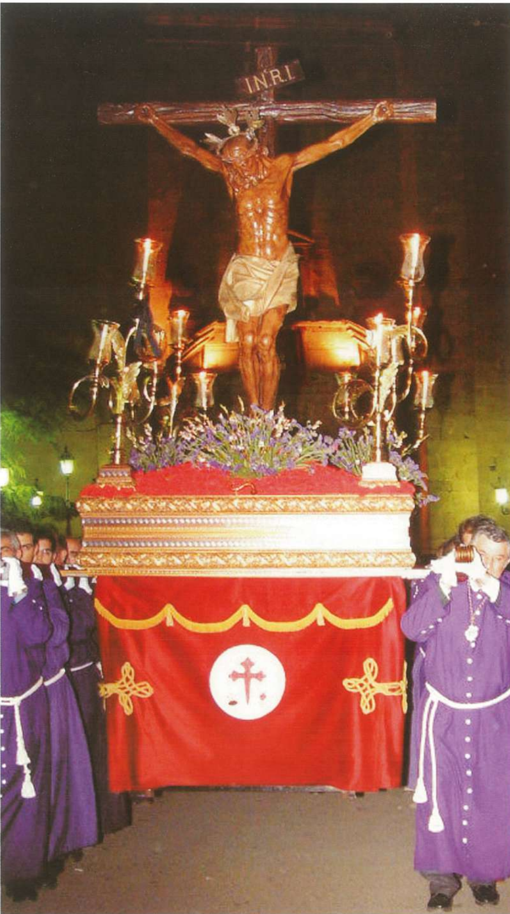
Stmo. Cristo de la Pobreza