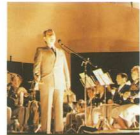
Pregón año 1988

Con el paso de los años, se incorporan nuevos actos al desarrollo de la Semana Santa, realizándose varias exposiciones de arte sacro, así como de carteles de Semana Santa, de fotografías de la imaginería de Villanueva.