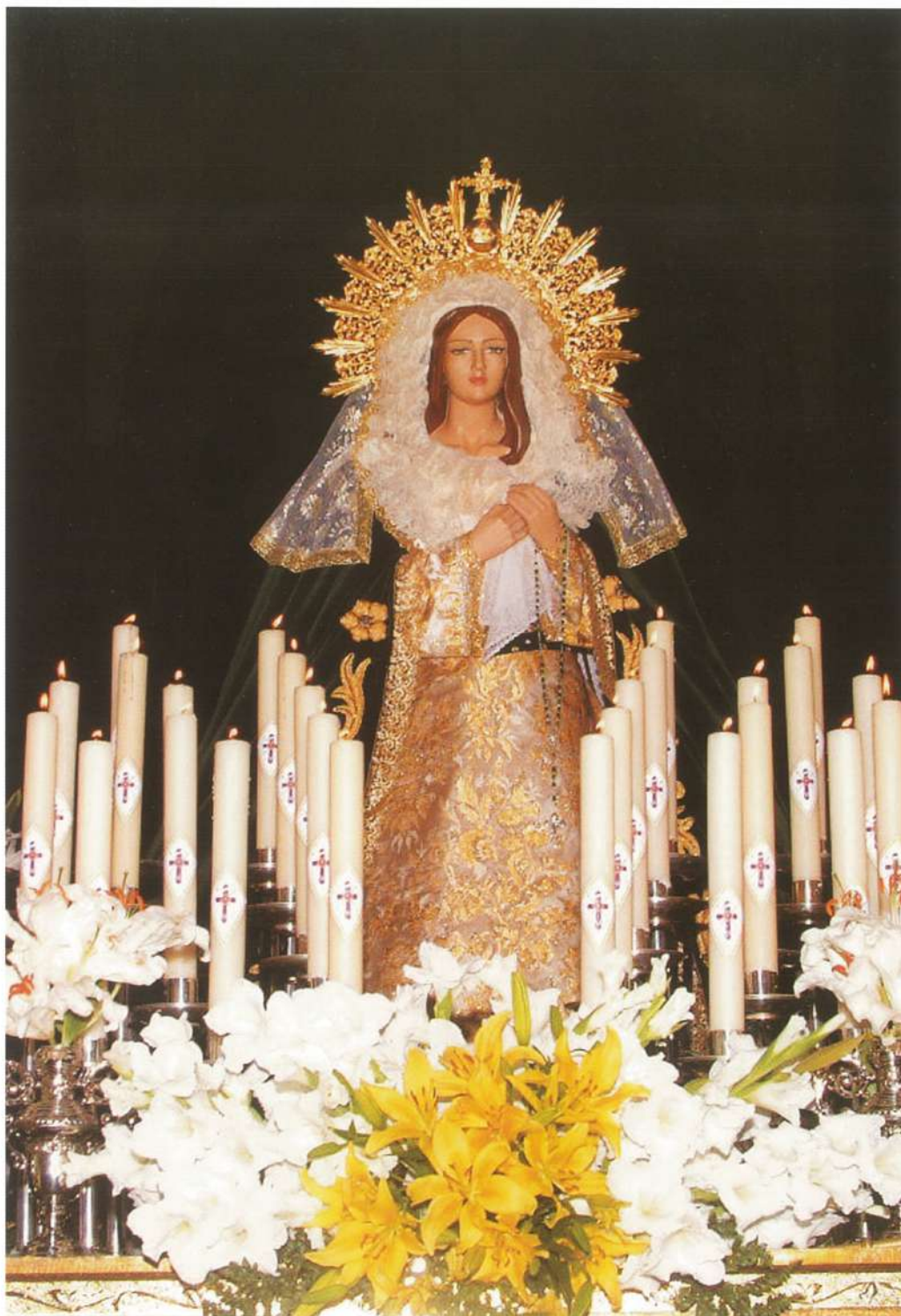
Ntra. Sra. del Calvario

Banda: Banda de tambores y cornetas de la Cofradía.